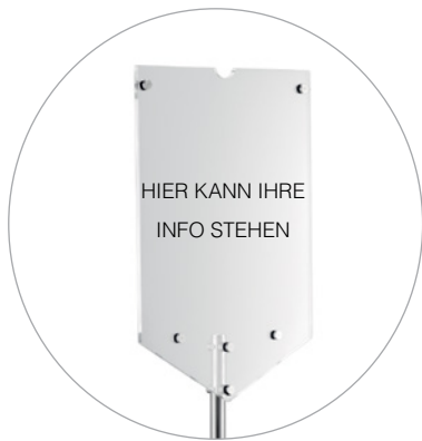
Wechseldisplay | exchangeable display