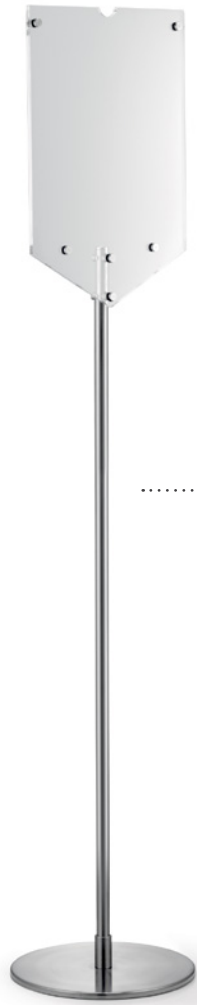
59 HWS Hinweisständer | Edelstahl information sign | stainless steel